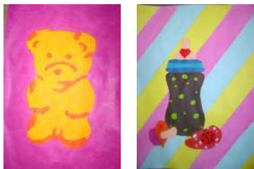
( einige der ausgestellten Bilder )

Kaktus Münster e.V. hat in Kooperation mit der Fürstin von Gallitzin Realschule die Ausstellung „Kunst als Kontext“ organisiert. Zu sehen sein werden Werke von Schülerinnen und Schülern der Fürstin von Gallitzin Realschule. Die vielfältigen Bilder spiegeln wieder, was die Jugendlichen beschäftigt und worüber sie sich Gedanken machen.